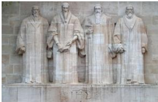
Farel Calvino Beza Knox Monumento de la Reforma en Ginebra, Suiza